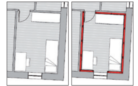
La stessa stanza prima e dopo il montaggio della MADIS ROOM, spazio utile e arredo restano invariati.

te una fotocopia della precedente. La rivoluzionaria cellula antisismica brevettata da Madis Costruzioni garantirà la sicurezza dei suoi abitanti sopportando qualsiasi tipo di urto, smottamento e il carico di macerie. Una straordinaria invenzione che rivoluziona le frontiere dell'antisismica, un investimento in sicurezza e tranquillità che cancella l'ansia da terremoto e protegge quel che abbiamo di più prezioso, la vita, la nostra e quella di chi ci sta a cuore.